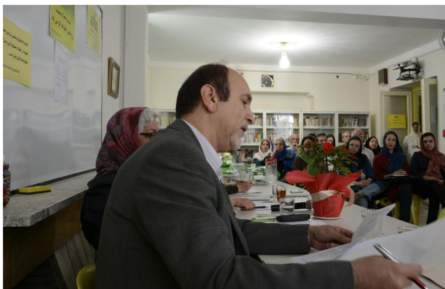
پیام بان کی مون دبیر کل سازمان ملل متحد به مناسبت روز جهانی خانواده ۱۵ مه ۲۰۱۶ برابر با ۲۶ اردیبهشت ۱۳۹۵

امسال، روز جهانی خانواده با برهه‌ای از تحول و فاجعه برای خانواده‌ها در سراسر جهان مصادف است. ظهور افراط‌گرایی خشونت‌آمیز، اثرات جابه‌جایی‌های اجباری، رخداد‌های شدید آب و هوایی و سایر چالش‌ها موجب خسارت سنگین بر سلامت و کرامت خانواده‌ها در موقعیت‌های بحرانی شده است. حتی در جوامع نسبتاً با ثبات، خانواده‌ها هنوز با خشونت، تبعیض و فقر مبارزه می‌کنند.